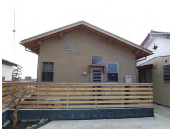
小さい窓はロフトから桜を眺めるための「桜窓」です