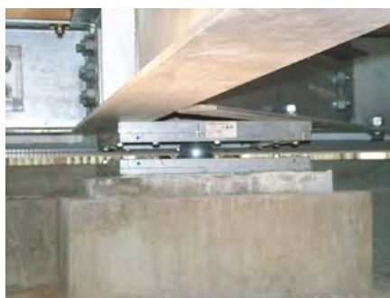
【転がり免震支承】 ボールが回転し揺れを吸収