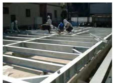
上部構造の耐震要素(柱・耐力壁等) の直下には鋼製鋼製土台を設置