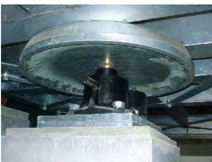
【全方位型ダンパー】 地震揺れ変位を抑制